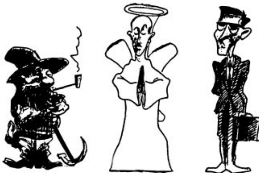
Slika 4. Švajcarski komentar o kulturnoj teoriji: pionir, sveti čovek, činovnik.

N a svojoj karikaturi pionira, svetog čoveka i birokrate (Slika 4) Kristijan Bruner (1989) prikazao je tri od naše četiri osobe koje nedostaju, to jest tri politički aktivne osobe kulturne teorije. Individualista je prikazan kao pionir; u radnom odelu, sa pijukom u ruci on nam izgleda samozadovoljan i samodovoljan. Sektaš, član enklave, sveti čovek ima oreol, krila i belu odoru. Predstavnik hijerarhije je činovnik sa akten-tašnom; njegovo držanje je nadmeno. Ove tri osobe nisu prikazane kako raspravljaju, ali nam je sasvim jasno kako će međusobno razgovarati.